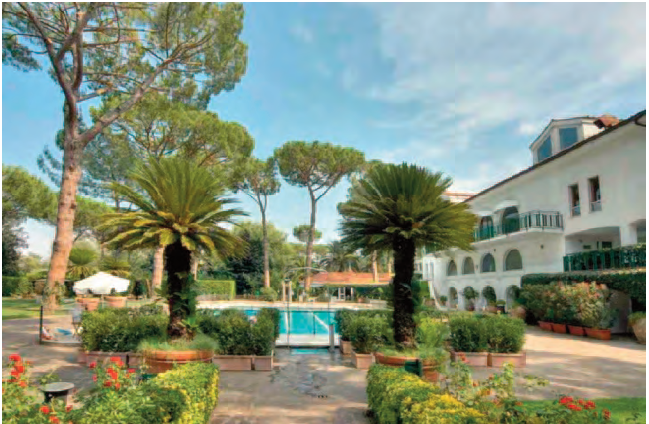
Circolo degli Esteri. Palazzina storica.