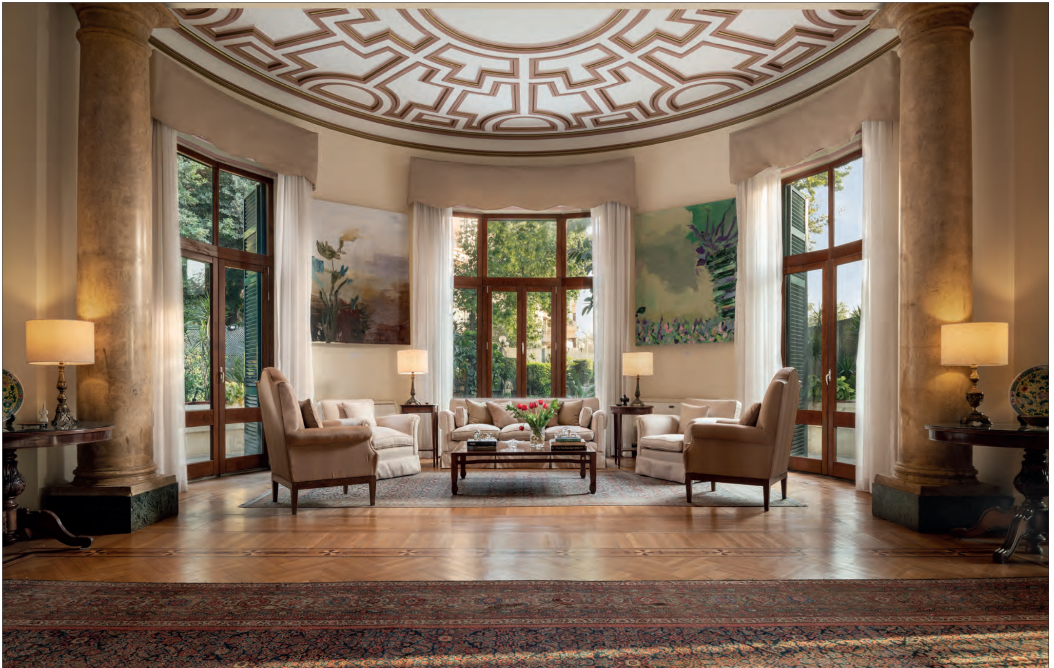
"Chiostrino" del Salone principale, lato giardino.