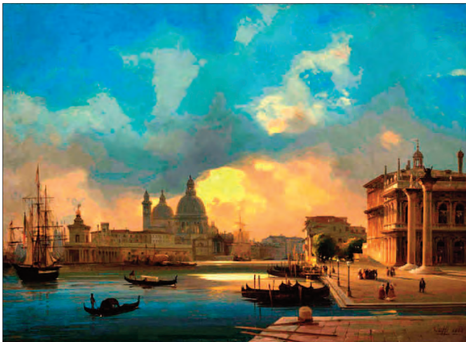
Ippolito Caffi. Veduta di Venezia, il Molo al tramonto, 1864.