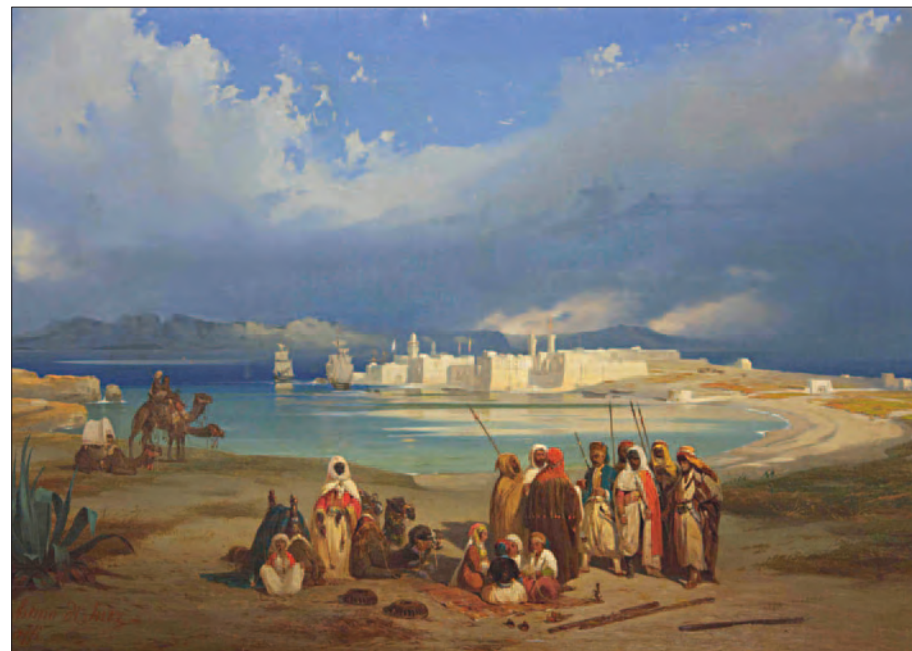
Ippolito Caffi, L'Egitto e l'Istmo di Suez , 1844.