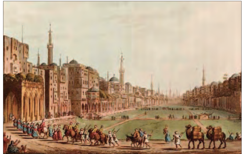
La piazza principale del magnifico Cairo con il Palazzo di Murad Bey . L'immagine proviene dalla raccolta di vedute di Luigi Mayer, "Views in Egypt" in possesso di Sir Robert Ainslie, effettuate in occasione della missione diplomatica di quest'ultimo a Costantinopoli; furono incise da Thomas Milton e stampate da T. Bensley per R.Bowyer nel 1801. Esse divennero un vero e proprio bestseller dopo la invasione napoleonica dell'Egitto.