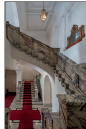
Particolare della balaustra in marmo della rampa dello scalone in corrispondenza dell'accesso all'appartamento privato dell'Ambasciatore.