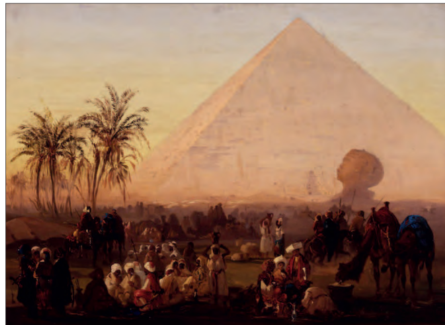
Ippolito Caffi. Riposo di una carovana , 1844.