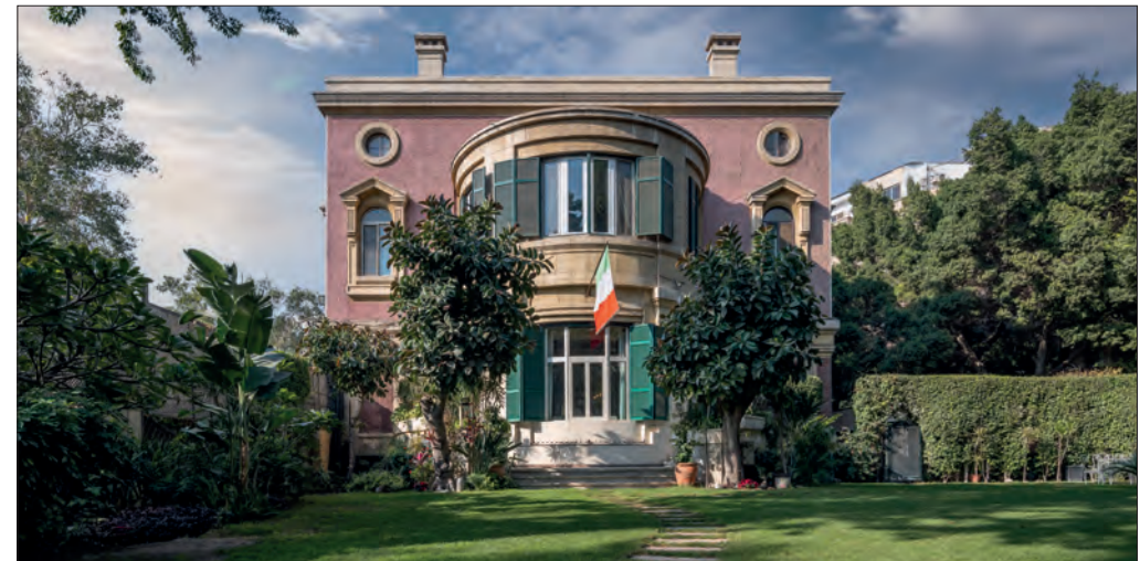
Giardino della Residenza.