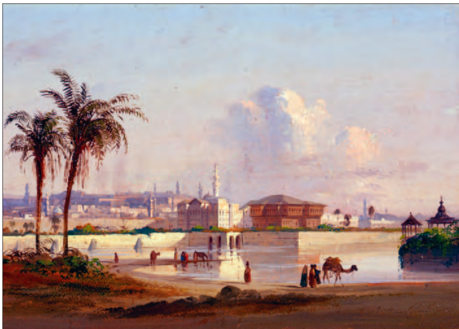
Ippolito Caffi, Egitto, Cairo - Palazzo del Pascià , 1844.