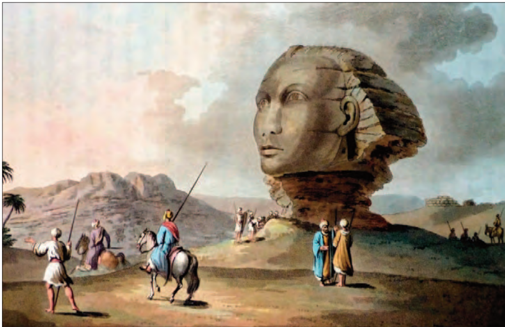
La testa della Sfinge colossale . L'immagine proviene dalla raccolta di vedute di Luigi Mayer, "Views in Egypt" in possesso di Sir Robert Ainslie, effettuate in occasione della missione diplomatica di quest'ultimo a Costantinopoli; furono incise da Thomas Milton e stampate da T. Bensley per R.Bowyer nel 1801. Esse divennero un vero e proprio bestseller dopo la invasione napoleonica dell'Egitto.