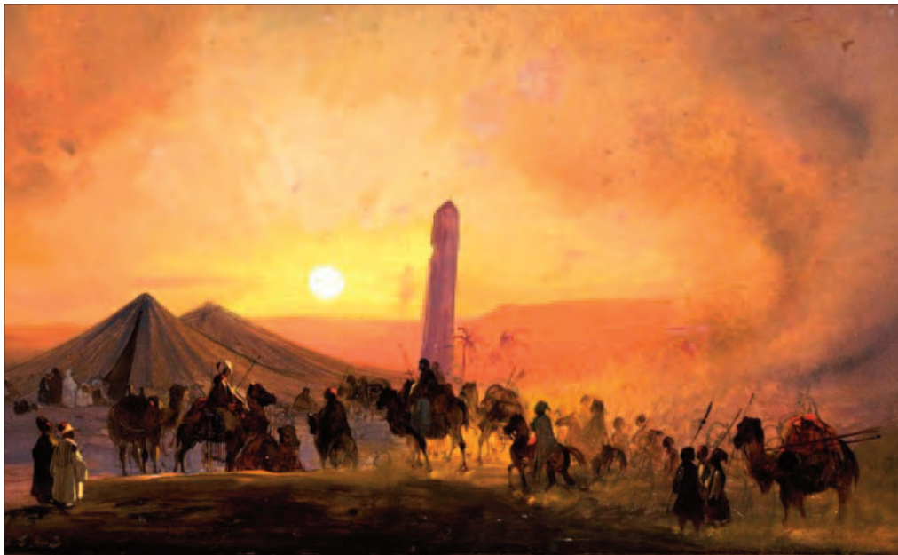
Ippolito Caffi, Egitto, carovana nel deserto , 1843.