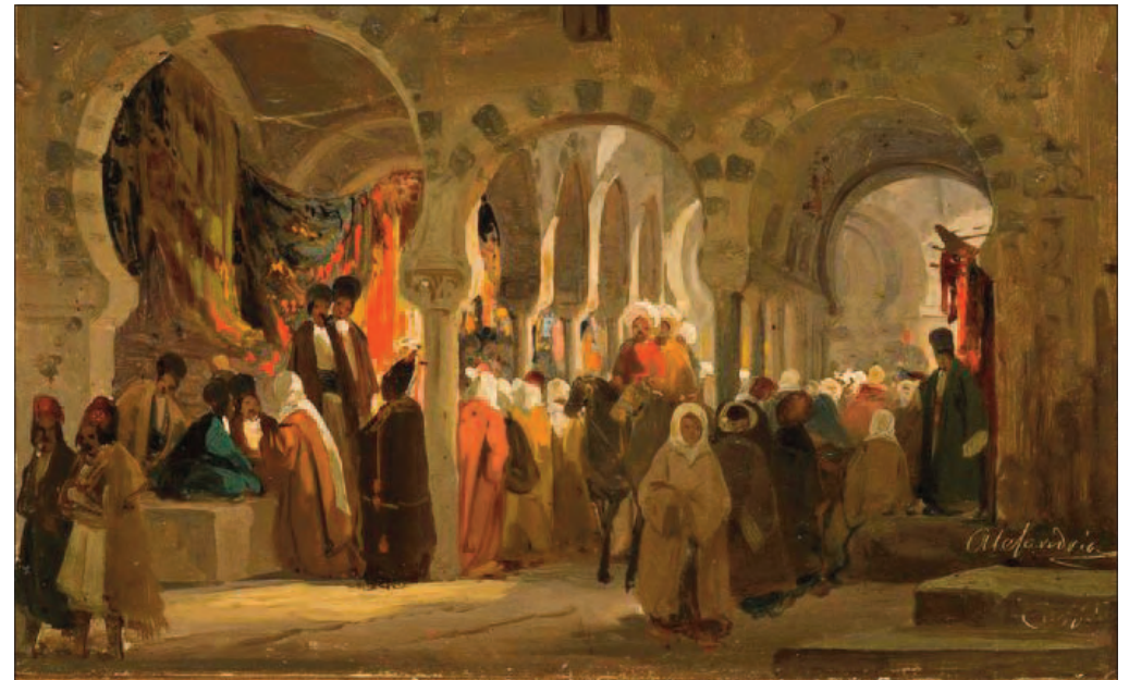
Ippolito Caffi, Egitto, Bazar di scialli (in Alessandria) , 1843/44.